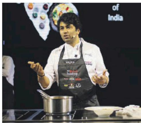
TALENTO Tra gli ospiti tanti chef internazionali